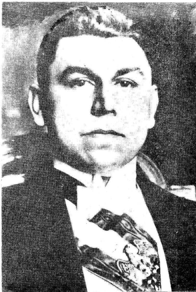
Don Adolfo de la Huerta