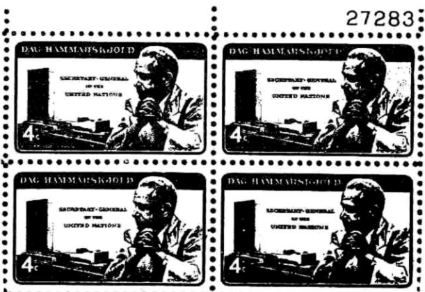
Timbre con la efígie de Hammarskjöld, Secretario General de la ONU, muerto trágicamente en Africa, emitido por los Estados Unidos.

El caso de los timbres de "Alimentos para la Paz" en el Paraguay es lamentable y no deseamos que se repita en parte alguna.