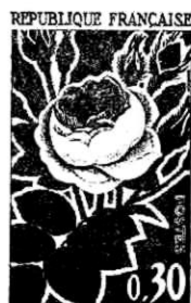
Timbres con bellos diseños de flores

La filatelia temática o iconográfica sigue creando nuevos adeptos día a día y el hecho es que hasta los sellos de los países menos populares entre los coleccionistas, son buscados ávidamente por los que coleccionan timbres postales según sus temas pictóricos y puede decirse que casi no hay serie de tipo pictórico de las emisiones modernas cuyo precio no veamos subir año tras año como consecuencia de esta demanda tan extraordinaria ocasionada por el aumento de coleccionistas y el creciente interés en la iconografía filatélica.