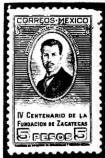
Timbre emitido en 1946 con motivo del IV Centenario de Zacatecas.

Preparábase en México el advenimiento de la revolución nacional cuando don Francisco Madero, candidato a la presidencia, visitó San Luis. López Velarde sumóse a sus partidarios. Poco después, encarcelado el político, colaboró en su defensa. Licenciado en 1911, el poeta fue juez en Venado durante pocos meses. Trasladóse a la ciudad capitalina, donde fue profesor de literatura española en la Escuela Nacional Preparatoria y funcionario de la universidad. Asimismo desempeñó funciones, aunque poco importantes, en la cancillería.