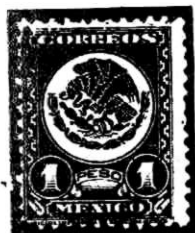
El águila en los timbres de México

Sin salirnos del tema de las águilas es curioso observar cómo éstas van cambiando dentro de un mismo país al calor de las circunstancias políticas. Así el águila bicéfala austriaca de la época imperial la vemos transformarse luego en águila de una sola cabeza en la época republicana, y a nuestra águila mexicana la vemos de frente y de perfil, y en la emisión de Maximiliano, hasta con una corona imperial en la cabeza.