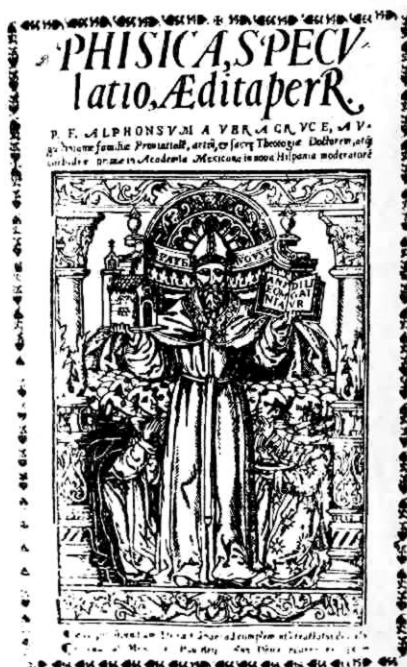
Otro texto del mismo autor, también impreso en México en el Siglo XVI.