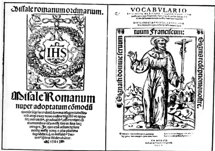
Misal Romano impreso en 1561 con un grabado de madera y tipografía gótica.

México debe un lauro a José Toribio Medina.