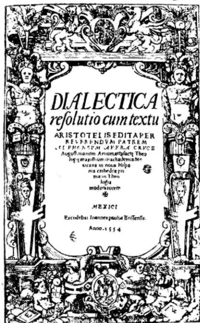
La "Dialéctica" de Fray Alonso de la Veracruz, Texto de la Universidad.

La obra más extensa y mejor documentada que jamás se haya producido acerca de la primera imprenta en América y de su desarrollo en México, se debe al erudito y laborioso chileno don José Toribio Medina que escribió e investigó largos años, reuniendo un millar de