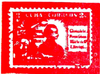
Gabriel de la C. Valdés. En un timbre de Cuba.

Aprendió el oficio de peinetero, en el que se hizo notable por la maestría con que ejecutaba sus trabajos en carey.