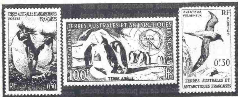
Timbres de Francia, también de la región Antártica.

Los timbres de la Antártida, con todo su interesante fondo político e histórico, constituyen un atractivo grupo para aquellos que deseen formar una colección interesante que promete tener un activo desarrollo en años venideros, colección que puede adicionarse con los muchos sobres que existen en el mercado con matasellos y estampaciones conmemorativas de vuelos, viajes y expediciones científicas y políticas a esas regiones polares.