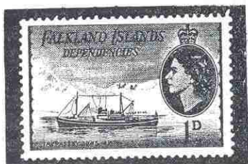
Timbres de Inglaterra emitidos en las Islas Falkland.

Los timbres de la Antártida, con todo su interesante fondo político e histórico, constituyen un atractivo grupo para aquellos que deseen formar una colección interesante que promete tener un activo desarrollo en años venideros, colección que puede adicionarse con los muchos sobres que existen en el mercado con matasellos y estampaciones conmemorativas de vuelos, viajes y expediciones científicas y políticas a esas regiones polares.