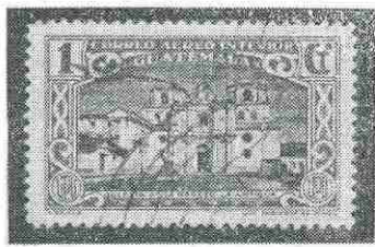
Ruinas de la Escuela del Cristo.— Iglesia de la Merced.

cos, además el Palacio Arzobispal, proyectado en 1784 por Bernasconi, autor también de la fuente monumental que se colocó en la Plaza de Armas. Esta fuente, terminada en 1789 por el maestro de cantería Manuel Berruncho, consistía en un templete de mármol de Barbales, que cubría una estatua ecuestre de Carlos IV, tallada en un solo bloque del mismo material.