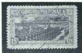
Palacio Nacional de la Antigua.— Palacio de los Capitanes de la Antigua Guatemala.

Lo que más fama dió a Guatemala fue la escultura, no obstante su vecindad con la Nueva España, que ya en 1543 recibía envíos de imágenes, muchas de las cuales se conservan en las iglesias y museos mexicanos. La perfección en el estofado, identifica a los imagineros guatemaltecos.