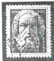
HOMERO Timbre de Grecia

SU VIDA Y SU OBRA: Todos lo presentan anciano, aunque con gran entereza física, con luengas barbas y cabellera blanca, ciego y ostentando en su diestra la lira, con que acompañaba la recitación de sus cantos o rapsodias heroicas. Como todo aedo, recorría pueblos y ciudades narrando las hazañas y episodios en los que evocaba a sus antepasados y a veces a los casi coetáneos. Probado es ya que en los tiempos homéricos no había aparecido aún el alfabeto griego y que, por tanto, Homero creó de memoria sus versos inmortales.