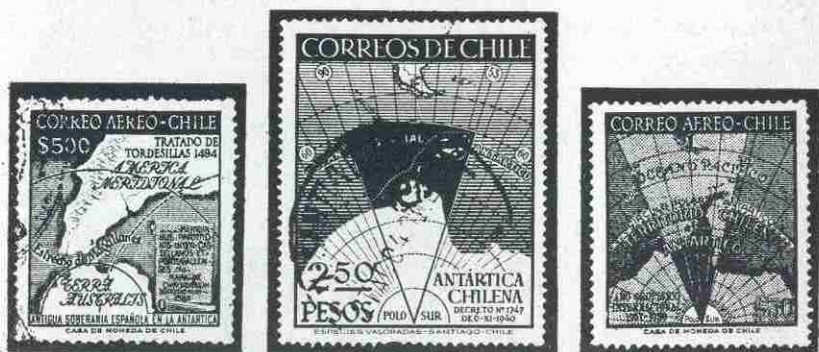
Timbres de Chile, en los que aparece la región antártica, como parte de Chile.

Más recientemente aún, Argentina en 1954 emitió un timbre conmemorativo del cincuentenario de la oficina radio postal de las Orcadas del Sur que representa el acto de clavar la bandera argentina en aquellas tierras, y ante este nuevo ataque respondió la Gran Bretaña a fines de ese mismo año con el timbre de uno de sus condominios, Australia que emitió un timbre para dar publicidad a la Expedición Nacional Antártica Australiana, en el que el diseño central lo constituye nada menos que un mapa del sector antártico australiano que aunque un poco ajeno a las pretensiones argentinas y chilenas puso una vez más en realce el interés británico por aquellas regiones polares.