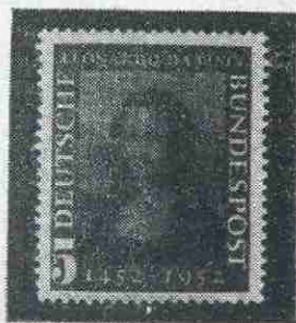
Timbre Alemán emitido con motivo del 500 aniversario del nacimiento de Leonardo de Vinci.

Desde agosto de 1911 y durante casi dos años y medio, la policía francesa y los periódicos de todo el mundo se ocuparon del misterioso hurto. Una acreditada revista ofreció cuarenta mil francos de oro a quien entregara el cuadro a su redacción y diez mil a la persona que proporcionase una pista para recuperar a "la inmortal Monna Lisa de la enigmática sonrisa". Los detectives franceses pudieron reconstruir exactamente el robo, pero no encontraron a su autor. Hasta inquirieron en la miserable habitación de un pintor de brocha