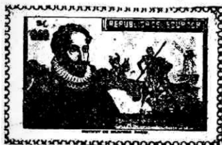
Timbre de Ecuador Efigie de Cervantes

El año 1605, en la imprenta de Juan de la Cuesta, se imprime la primera edición de Don Quijote de la Mancha , el andariego caballero, que sigue y seguirá sus andanzas por el mundo... y, en el mismo año se hicieron seis ediciones y la fama de Cervantes igualó a la de Lope de Vega.