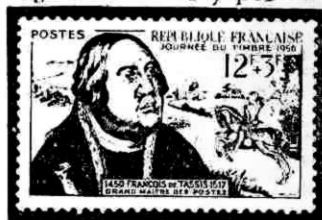
Francois de Tassis Concesionario para el servicio de correos de Europa.

principales: Unificación de pesos, precio y simplificación de las cuentas. En 1875 se celebró otro Congreso en Berna. Suiza, al cual asistieron representantes de 38 gobiernos que dejaron fundada la Unión General de Correos que puso en comunicación a 345 millones de habitantes. Entre los acuerdos que tomaron, figura el de que los países que entraran en el tratado formarían un solo territorio postal en lo referente a las comunicaciones. Se firmó un tratado por tres años, que empezó a regir en 1879, pero considerando el plazo indefinidamente prorrogable, y se creó en Berna una oficina (Bureau International de l'Union Postal) para resolver todas las dudas que pudieran suscitarse. Este tratado se firmó después de otro Congreso más importante que el de Berna, celebrado en París en 1878 con el mismo fin, y como ya estaba preparado por el congreso anterior y por un periódico órgano de la Unión, sus trabajos pudieron ser más rápidos. En esta reunión se cambió el nombre de Unión General de Correos, por el de Unión Postal Universal, en la que resultaron unidos 750 millones de habitantes. Se siguen celebrando congresos, aproximadamente cada 5 años, en diferentes países. Un Ejecutivo compuesto de 19 naciones, que representan las principales regiones mundiales, dirige permanentemente la Unión. La sede central radica en Berna.