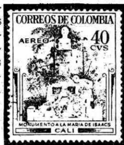
Monumento a la María de Jorge Isaacs Timbre de Colombia

Illuminada por la aureola de gloria que le proporcionó su libro la vida de Isaacs se deslizó hasta 1881, ya entregado a las lides de la prensa, ya a las luchas parlamentarias, pues fue diputado varias veces al Congreso de su país.