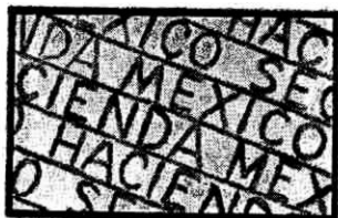
Marca de Agua 260

No creemos haber completado nuestra información sobre errores, pero los indicados demuestran que la acuciosidad y la dedicación del filatelista pueden encontrar una gran cantidad de aspectos en la Filatelia, diferentes al simple coleccionismo que aumentan la atracción y el valor de los timbres.