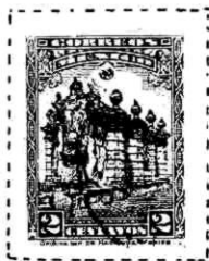
La fuente El Salto del Agua

La clase de papel que difiere del normal de la emisión también puede considerarse como error o variedad (papel grueso o delgado, o de alguna clase especial diferente al de la emisión general); las filigranas o marcas de agua, diferentes o invertidas entran a la categoría de errores; en México hay algunos timbres postales que llevan la filigrana de la Sria. de Hacienda en timbres de servicio postal y hay uno, el de 2c. (Fuente del Salto del Agua) de 1923, que con marca de agua de Hacienda puede valer mil pesos: el trabajo está en encontrarla entre miles de piezas de un solo tipo.