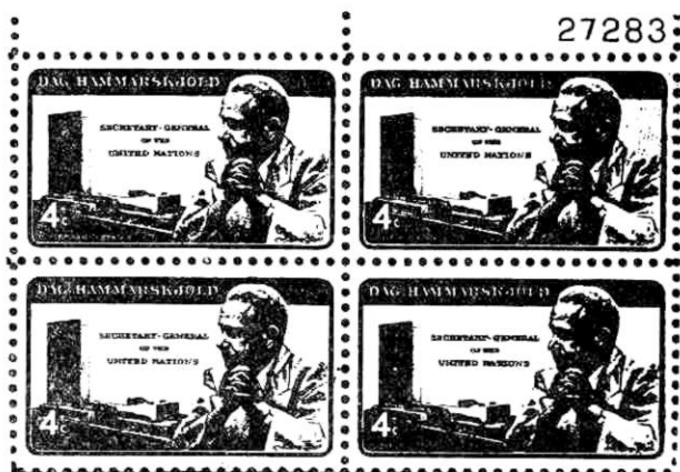
Timbre de Hammarskjöld a que se refiere este artículo

Al conocer lo sucedido en el Departamento de Correos de Washington, ordenaron la supresión inmediata de la venta, la que prontamente fue revocada, por una nueva orden del Administrador General de Correos para que se reimprimieran hasta 400.000 con el referido error.