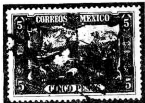
Timbre conmemorativo del Centenario de la Independencia.