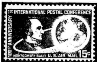
Mr. Montgomery Blair

Suprimida en 1867 la concesión que los Taxis tenían para hacer el servicio de correo en algunos países, éstos tomaron el servicio a su cargo, pero sucedió que cada país tenía sus normas, cosa que causaba muchos trastornos. El Director General de Correos de los Estados Unidos, Montgomery Blair el año 1862 propuso que se hiciera una reunión de representantes de todos los países, con objeto de unificar y mejorar los servicios postales; a esta reunión concurren delegados de 15 países, que acordaron hacer una Convención mundial. El 11 de mayo de 1863 se reunieron en París los representantes de todos los países, menos la República del Ecuador. En la conferencia se deliberó sobre 36 temas presentados, condensados en tres