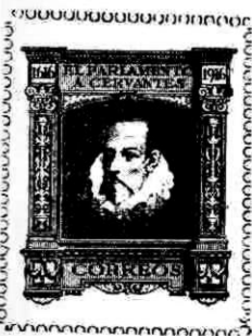
Retrato de Cervantes en un timbre de España

Su espíritu aventurero le llevó a entrar al servicio del Cardenal Acquaviva que había ido a Madrid con una embajada del Papa y con él se encontraba en Roma en 1569. Se alistó al año siguiente en la