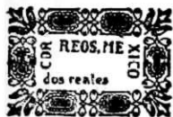
PROVISIONAL DE CHIAPAS.

Otro sello que se encuentra en el mismo grado de rareza es el 5 cts. "PROVISIONAL DE CAMPECHE" emitido en el año de 1876 del cual solamente se conocen dos ejemplares, siendo ellos propiedad de un coleccionista de esta ciudad de México.