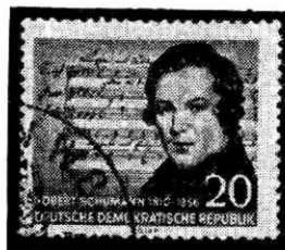
Músicos en los timbres.