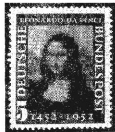
Timbres con cuadros famosos.