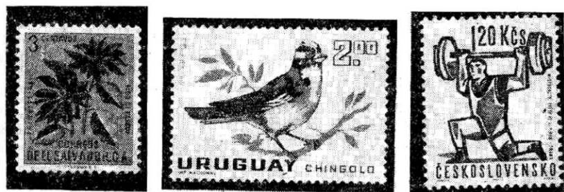
Animales, flores y deportes, tema favorito de coleccionistas temáticos.

En una colección iconográfica o temática hecha a conciencia y con conocimiento del tema, se incluye el sello de correo con el diseño que es motivo de la misma, y junto a él, se montan como en una colección especializada, que éstas también lo son, sobres del día de la emisión del timbre, sobres que testifican el uso postal normal del mismo, bloques, variedades de sellos, enteros postales, es decir, sobres, tarjetas cartas y tarjetas postales con sellos grabados o estampados del mismo tema, matasellos conmemorativos, de primer día de circulación, o de uso común, que por el dibujo que puedan tener o por su leyenda estén relacionados también con el tema de la colección;