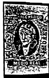
MEXICO No. 1

También agradeceré a mis compañeros filatelistas cualquier dato que conozcan de este tema.