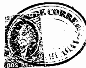
CS No. 3

Por su parte, el CC en las notas preliminares dice que se imprimieron 285,780 y 247,000 sellos de 2r con las placas 1 y 2 respectivamente. Al grabar nueva placa, Villegas la hizo con 200 sellos (20x10). Debido a su uso excesivo, la placa de 2r (debe referirse a la de 190) sufrió una pequeña rotura en la parte inferior, que afectó al timbre No. 189, el penúltimo. Dicha rotura que empezó afectando las letras 'E y A' de la palabra 'REALES' se fue extendiendo gradualmente y cruzando la cara de Hidalgo, terminó en la 'S' de CORREOS. En la misma placa existen otras roturas más pequeñas. Debido a que se usó la misma placa para las emisiones de 1861 y 1867, estos defectos dieron lugar a la variedad "placa rota". Con la placa 3 se imprimieron 1,052,600 sellos. El total da 1,585,380. Pero al CC le fallan los números, porque en otro apartado dice que fueron enviados 1,629,773. La diferencia corresponde a 44,393 que fueron rechazados, canjeados, etc., los cuales resta de la primera cifra para quedar en los 1,585,380 mencionados.