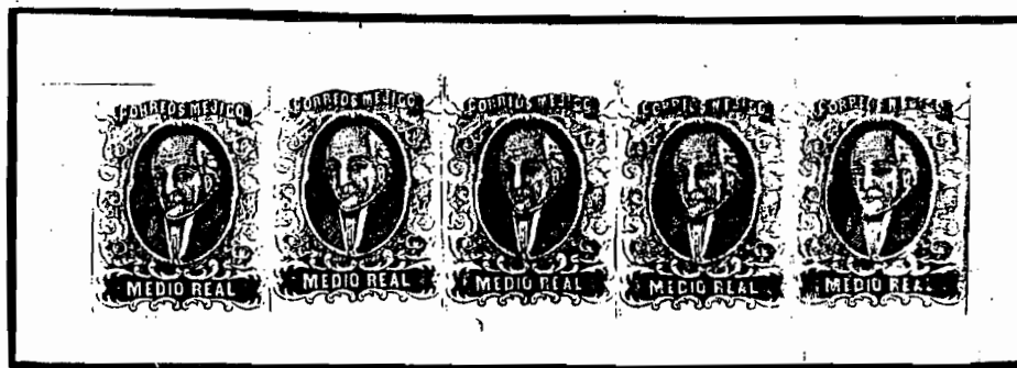
Fig. 1 No. 1, placa 1.