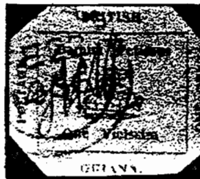
"REPLIK" de WINTER

N. del E.- Datos tomados del tabloide 'Linn's - Stamp News - de Abril 26/99 por JAIME BENAVIDES.