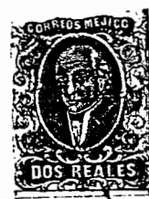
CS#8 - CC#10

La variedad "al" se conoce sólo en el distrito de PUEBLA. Del 2r se enviaron 960,776 timbres y se devolvieron 36,352 (no vendidos según el CC). Los distritos raros son los mismos que se mencionaron en la lista del 1r (CS#7), pero ahora hay que agregar a Lerma, Soyaniquilpan, Tepeji del Río, Tlalpan e Yguala y retirar a Hermosillo.