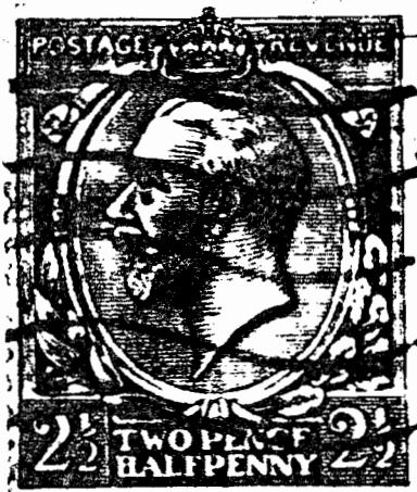
Fig.1-Sc.#163 tipo Downey