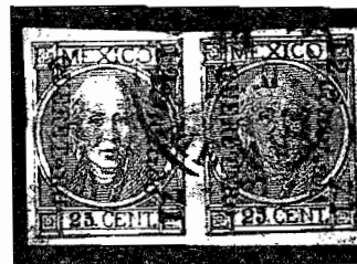
Fig. 1.- Par genuino del Sc. #73

N. del E.- Tema presentado por ANGEL MOYA SALDAÑA en la sesión del 1º de Nov. pdo., con el apoyo de acetatos amplificadas en la computadora y material original con anotados falsos.