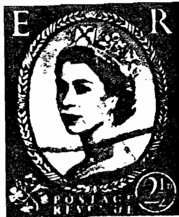
Fig. 2-Sc.#296 tipo Wilding